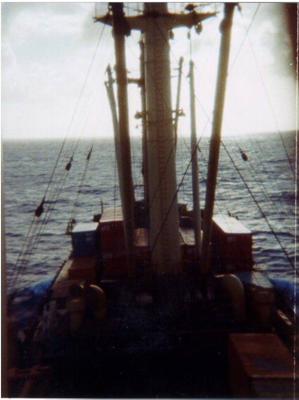
An Deck auf See